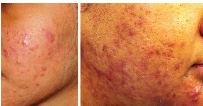
Gambar C& D: Pustular Acne

Untuk jerawat sederhana , kita boleh merawat dengan gabungan dua agen topikal. Jika jerawat tersebut jenis yang mempunyai banyak keradangan, pesakit juga akan diberi ubat makan antibiotic.