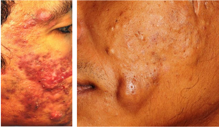
Gambar E & F: Nodulocystic Acne

Jika jerawat yang teruk, pesakit perlu dirujuk kepada pakar kulit untuk ubat makan isotretinoin. Ubat tersebut hanya boleh diberi oleh pakar dermatologi / pakar kulit yang sah. Jika terdapat apa-apa keraguan/masalah rawatan jerawat, sila menghubungi pakar dermatologi di klinik yang terdekat ( http://www.dermatology.org.my ).